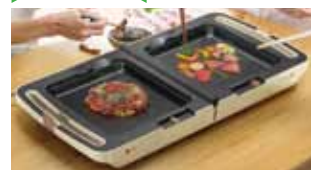
アイリスオーヤマ 両面ホットプレート DPO-133