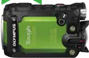
OLYMPUS STYLUS TG-Tracker