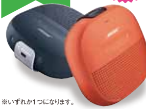
BOSE SoundLink Micro Bluetooth speaker