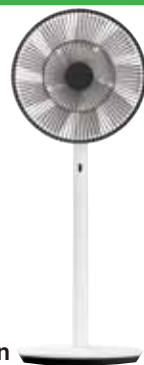
バルミューダ The GreenFan